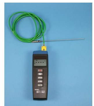
MIN/MAX Thermometer mit zusätzlichem Temperaturfühler