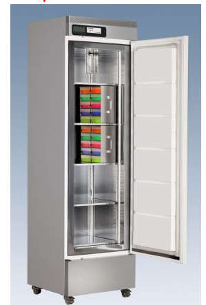
ProfiLine Pegasus PLPE 2545EWN (Abb. mit optionalen Kryoboxen. Siehe Katalog.)