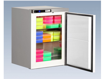
ProfiLine Pegasus PLPE 1086EWN (Abb. mit optionalen Kryoboxen. Siehe Katalog.)