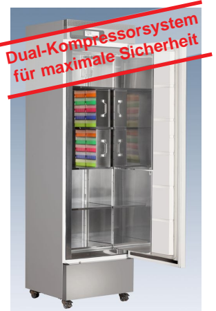
ProfiLine Pegasus PLPE 2586EWN (Abb. mit optionalen Kryoboxen. Siehe Katalog.)

Dual-Kompressorsystem für maximale Sicherheit